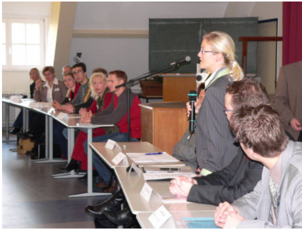
Wirtschaft trifft Schule

Haben Sie noch Fragen zum ALUMNI — Netzwerk für Ehemalige?