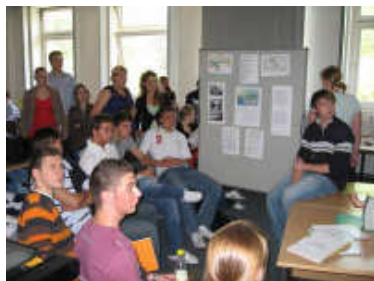
Schülerinnen und Schüler bei einer Projektvorstellung

Haben Sie noch Fragen zum Wirtschaftsgymnasium?